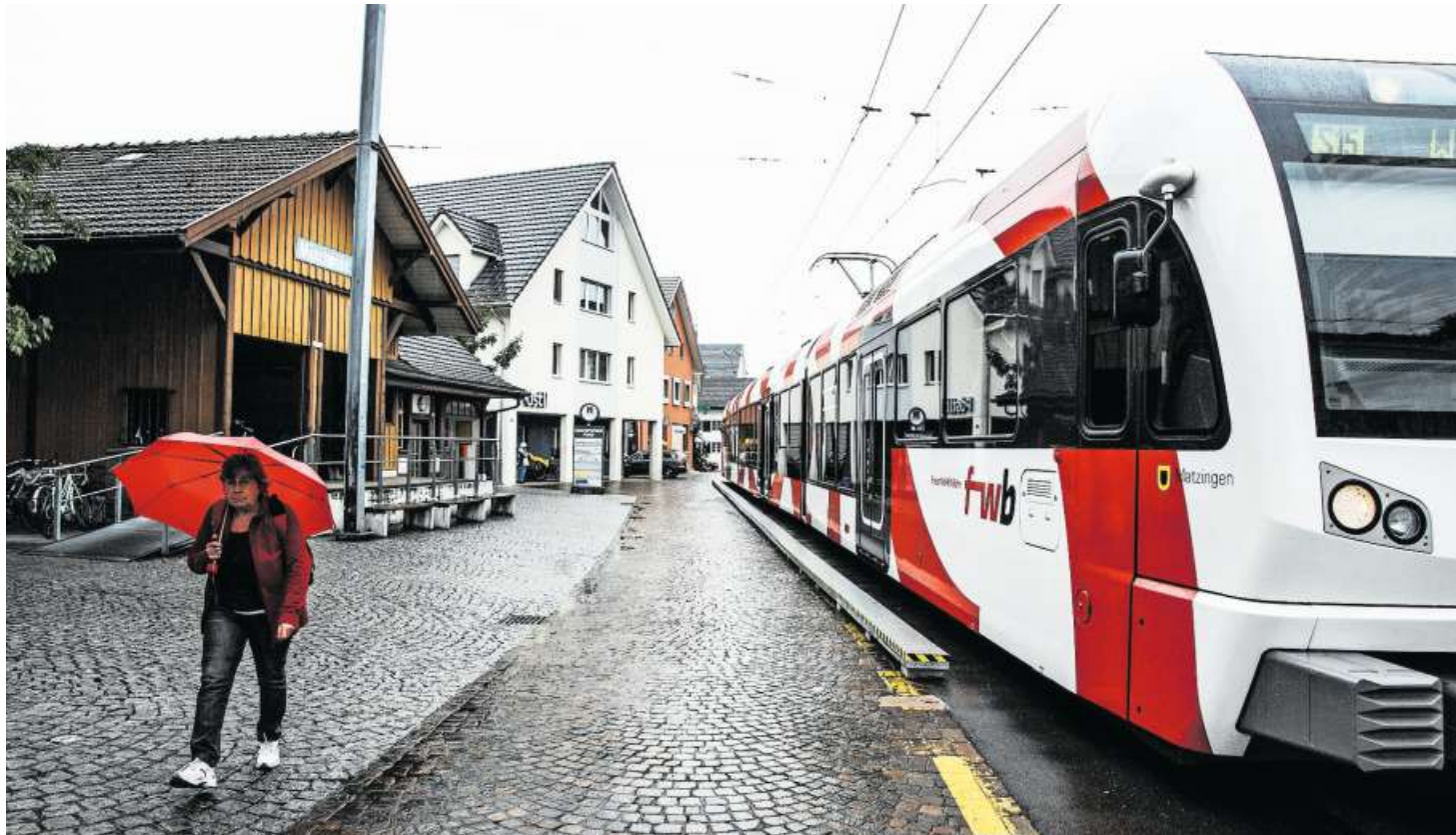
Münchwilen Zentrum ist nebst Jakobstal Wängi die letzte Hinterthurgauer Haltestelle der Frauenfeld-Wil-Bahn, die noch nicht barrierefrei ist.

Mittagstisch und Spiel, Anmeldung: Tel. 071 923 50 07, 11.30, Alterszentrum